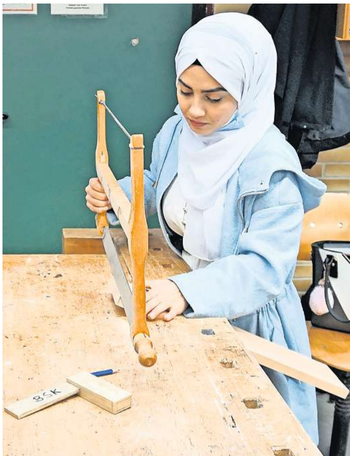
Beim Holzfachtag an den Beruflichen Schulen Kirchhain stellten 25 Schülerinnen und Schüler ein Frühstücksbrettchen her.